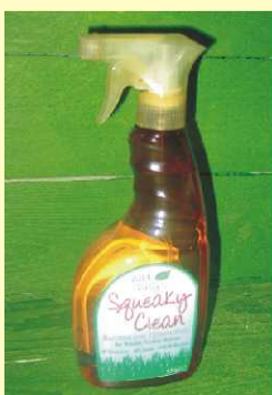
Rensevæske Til foderhuse og Redekasser