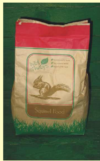
Egern Guf Squirrel Food Art. No.: 542110