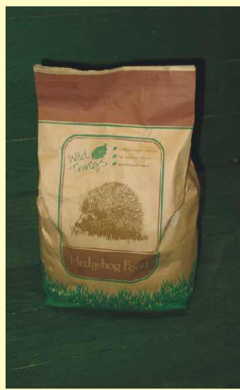
Pindsvine Dinner Hedgehog Food Art. No.: 542105