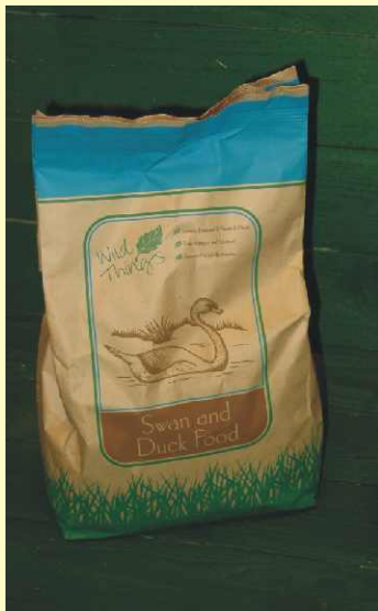
Svane /Ande Mad Swan / Duck Food Art. No.: 542100