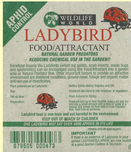
Mariehøne "Tiltrækker" Ladybird Attractant Art. No.: 541980