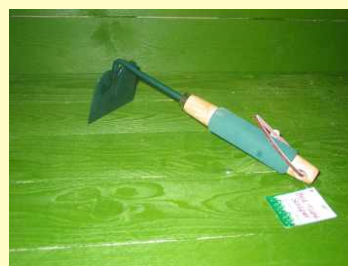
Renseskovl t/ foderbræt Art. No.: 542180